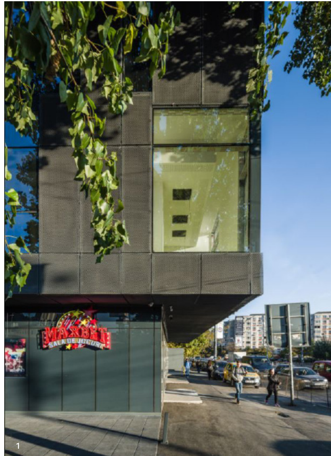
1 Fațadă Facade