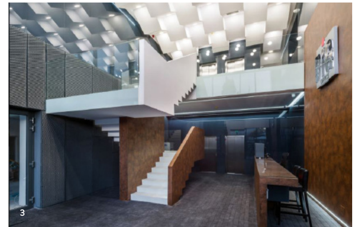
3 Lobby parter Ground floor lobby